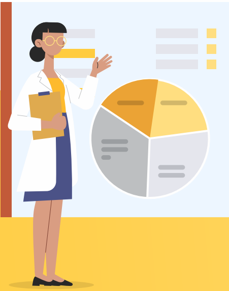
चार्ट 1: एमए (MA) मेडिसिंस स्टॉक न करने के कारण (% में) (N=187)